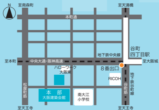
本部アクセスマップ

兵庫事業所 : 〒651-1303 神戸市北区藤原台南町 5-2-6 TEL/FAX (078) 981-9088 E-mail hyogo@shukai.or.jp